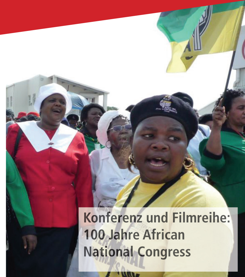
Konferenz und Filmreihe: 100 Jahre African National Congress